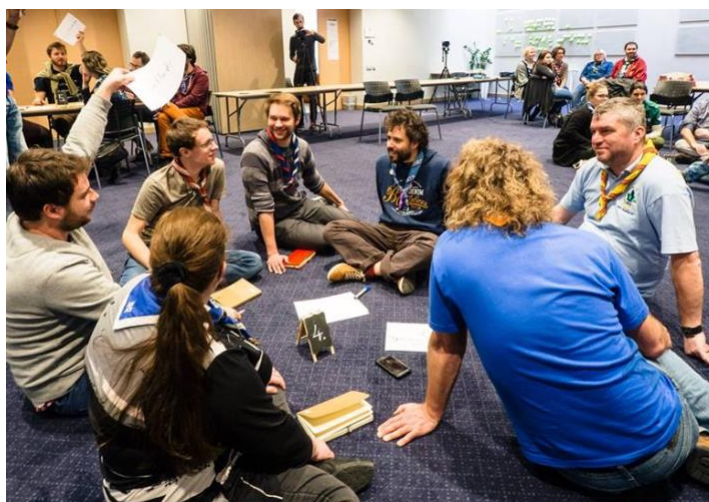
Travail en petite équipe à l'événement sur la Croissance de la Région Européenne du Scoutisme à Riga, en Lettonie, au printemps 2018.

France, Irlande, Israël, Norvège, Slovaquie, Turquie